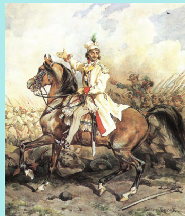
Juliusz Kossak, Kościuszko prowadzi kosynierów, 1882, archiwum prywatne