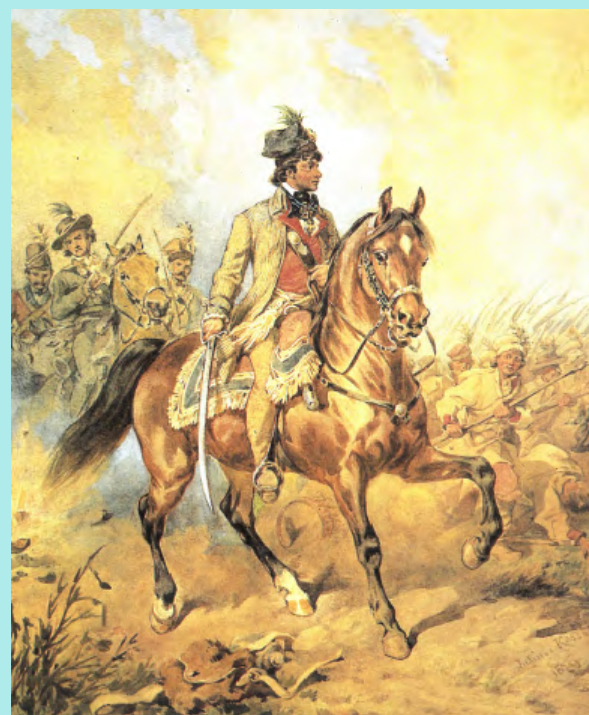
Juliusz Kossak, Kościuszko na czele kosynierów, 1879, archiwum prywatne