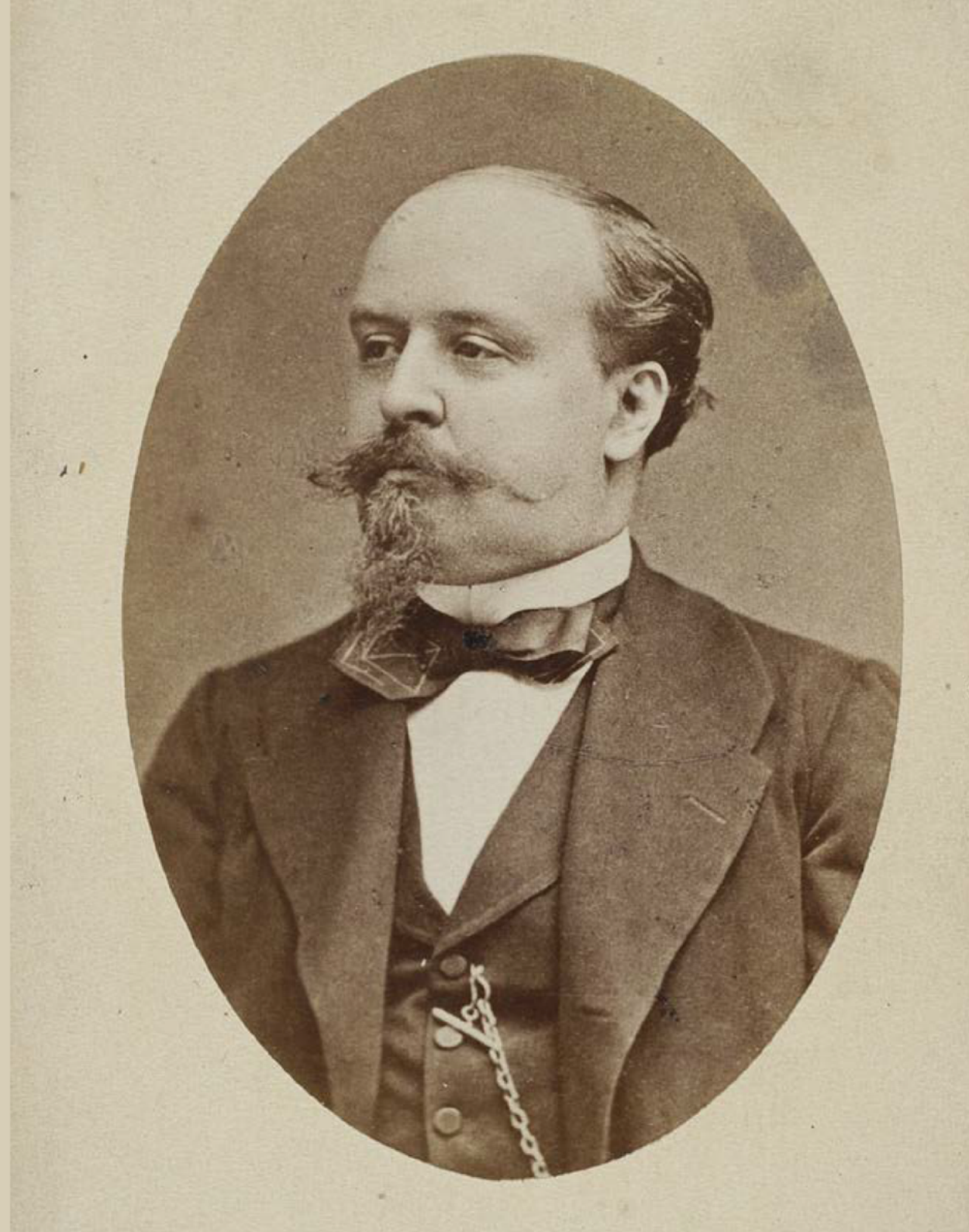
Portret Juliusza Kossaka, fot. Wojciech Piechowski, ok. 1882, Biblioteka Narodowa w Warszawie, źródło: Biblioteka POLONA