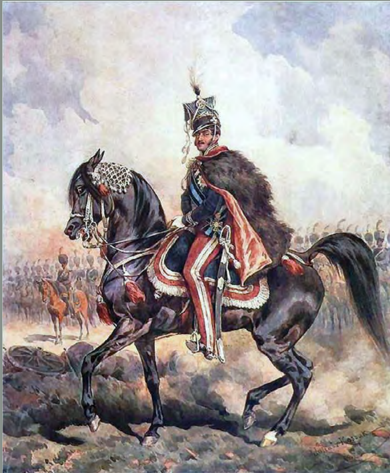
Juliusz Kossak, Portret księcia Józefa na koniu, 1879, Zamek w Łańcucie

Księżę Józef Poniatowski, syn Andrzeja Poniatowskiego herbu Ciołek, brata Stanisława Augusta – króla Polski, oraz księżniczki Teresy z Książąt Kińskich, dany dworu austriackiej cesarzowej Marii Teresy, był generałem, ministrem wojny, naczelnym wodzem wojsk Księstwa Warszawskiego i marszałkiem Francji. Księżę Pepi, jak go pieśczołliwie wśród rodziny nazywano, od dzieciństwa był przygotowywany do kariery wojskowej. Po śmierci ojca znalazł się pod opieką swojego stryja, Stanisława Augusta, który z miejsca zaczął mu wpajać miłość i przywiązanie do ojczyzny, do kraju, skąd pochodził jego ród i przodkowie.