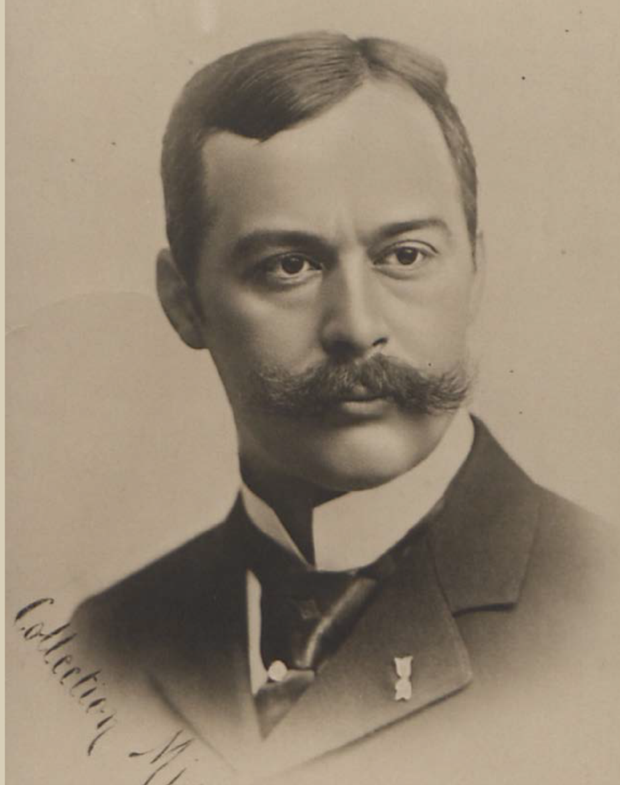
Wojciech Kossak, fot. Jules Mien, wyd. Salonu Malarzy Polskich, 1901. Biblioteka Narodowa w Warszawie, źródło: Biblioteka POLONA