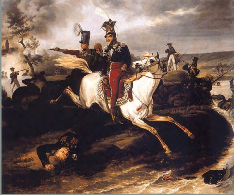
January Suchodolski (wg Horacego Verneta), Śmierć księcia Poniatowskiego w Elsterze, Muzeum Narodowe w Krakowie, źródło: Wikimedia Commons