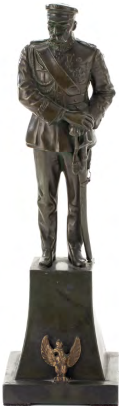
Figurka – Marszałek Józef Piłsudski, okres międzywojenny