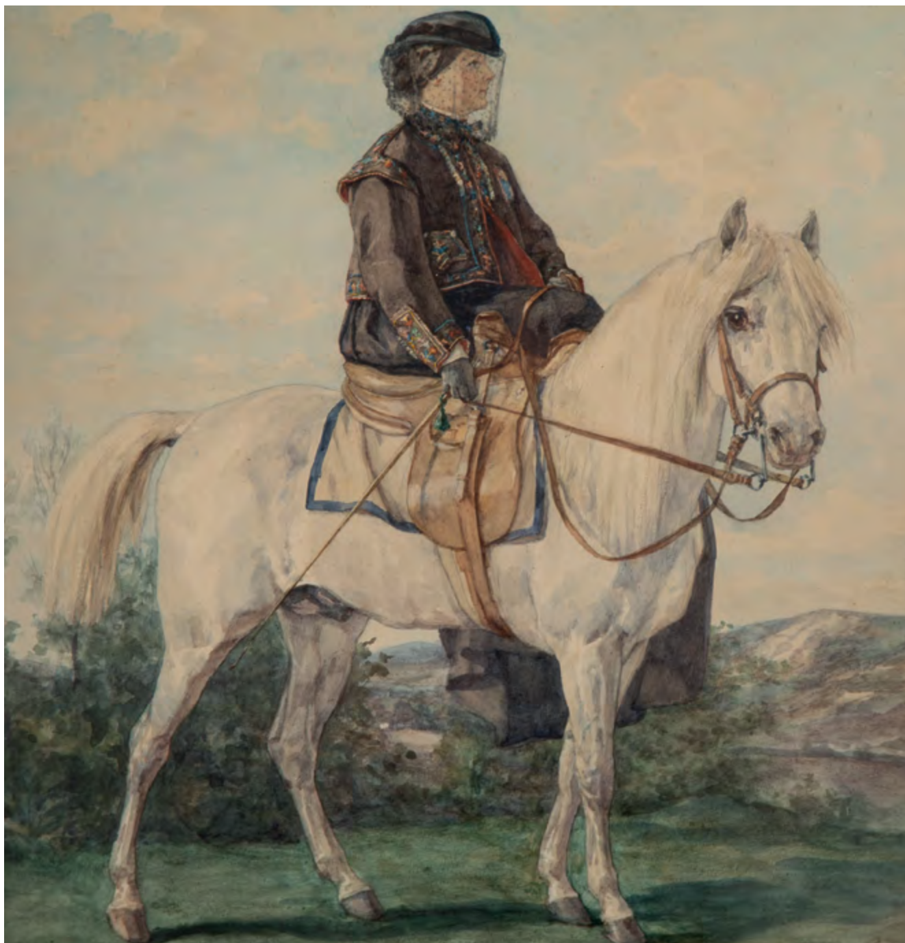
Henryk Rodakowski, Portret żony na koniu, 1868 r.