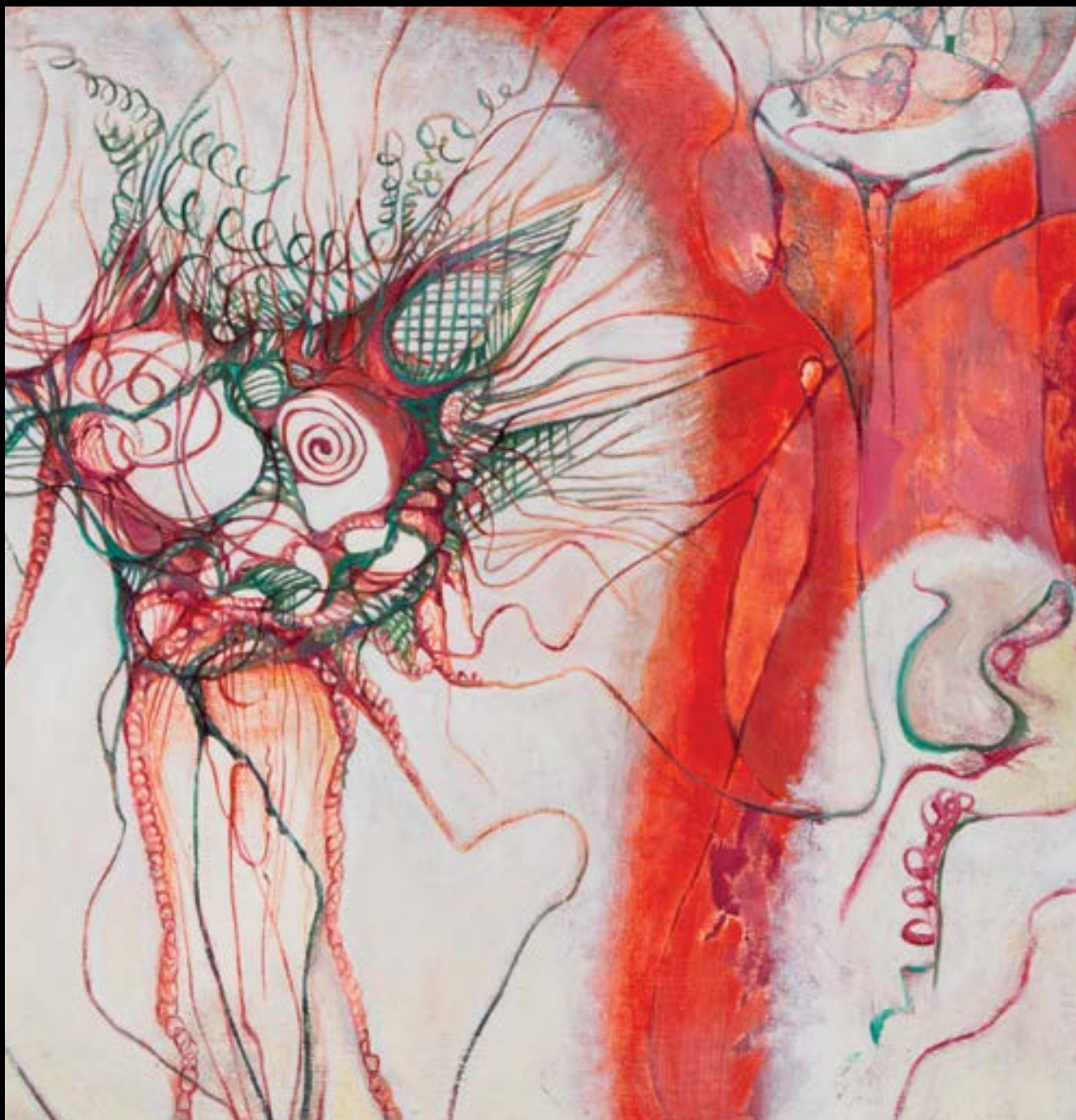
Erna Rosenstein, „Kwiaty piekła”, ok. 1965 r.