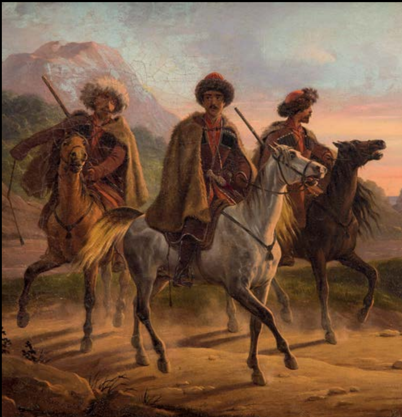
Januarius Suchodolski, Pejzaż kaukaski