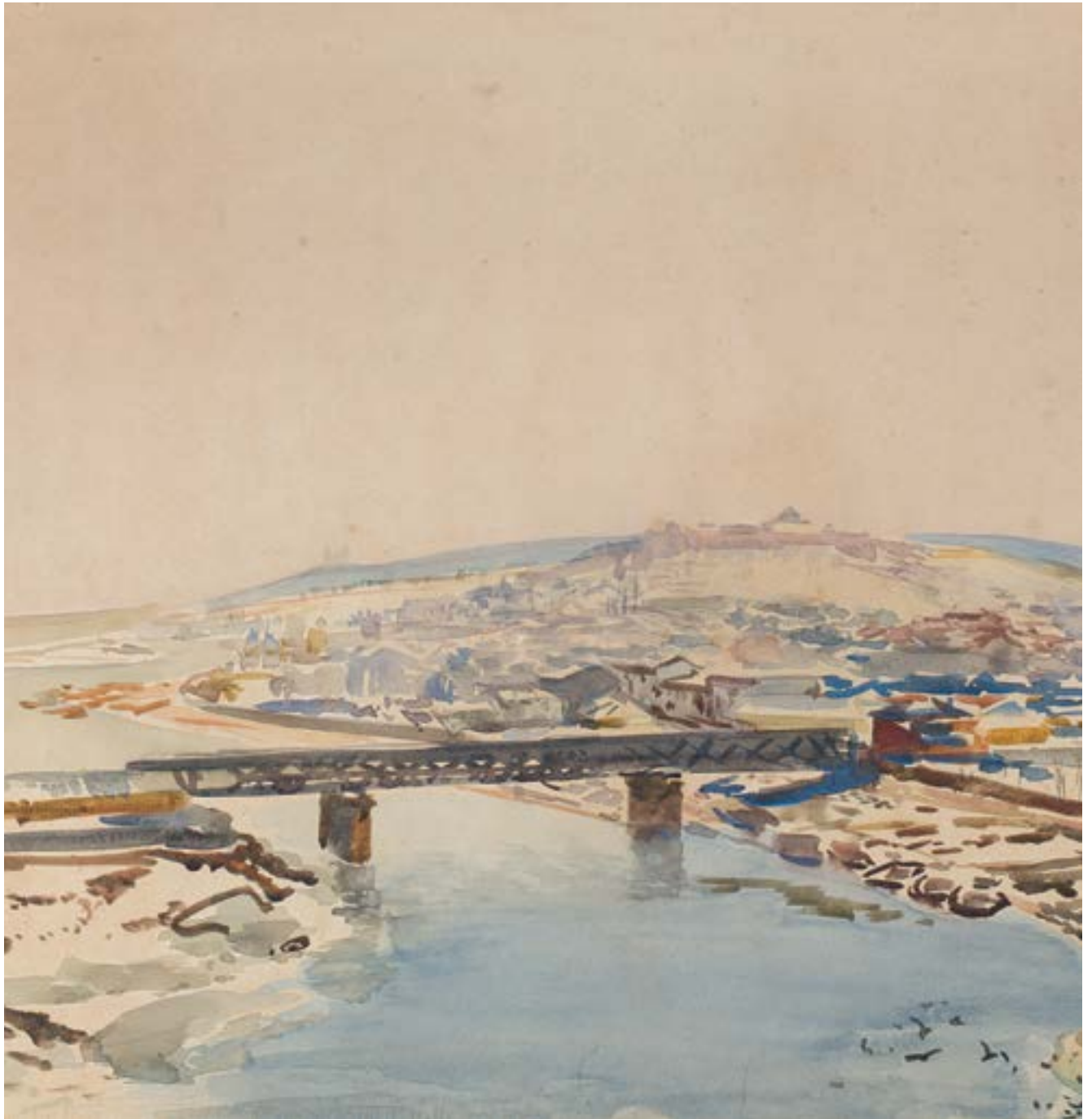
Leon Wyczółkowski, Widok na most Dębnicki w Krakowie, 1914 r.