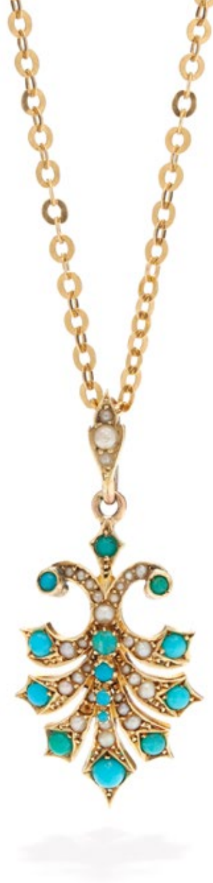
106 NASZYJNIK Z TURKUSAMI I PÓŁPERŁAMI około poł. XX w.

złoto pr. ~ 0,750, 14 turkusów, 29 półperł, masa: 8,37 g, dł. łańcuszka: 60 cm, wym. zawieszki: 3,6 x 1,7 cm