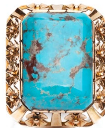
107 PIERŚCIEŃ Z TURKUSEM 2 poł. XX w.

estymacja: 6 000 - 8 000 PLN 1 300 - 1 800 EUR