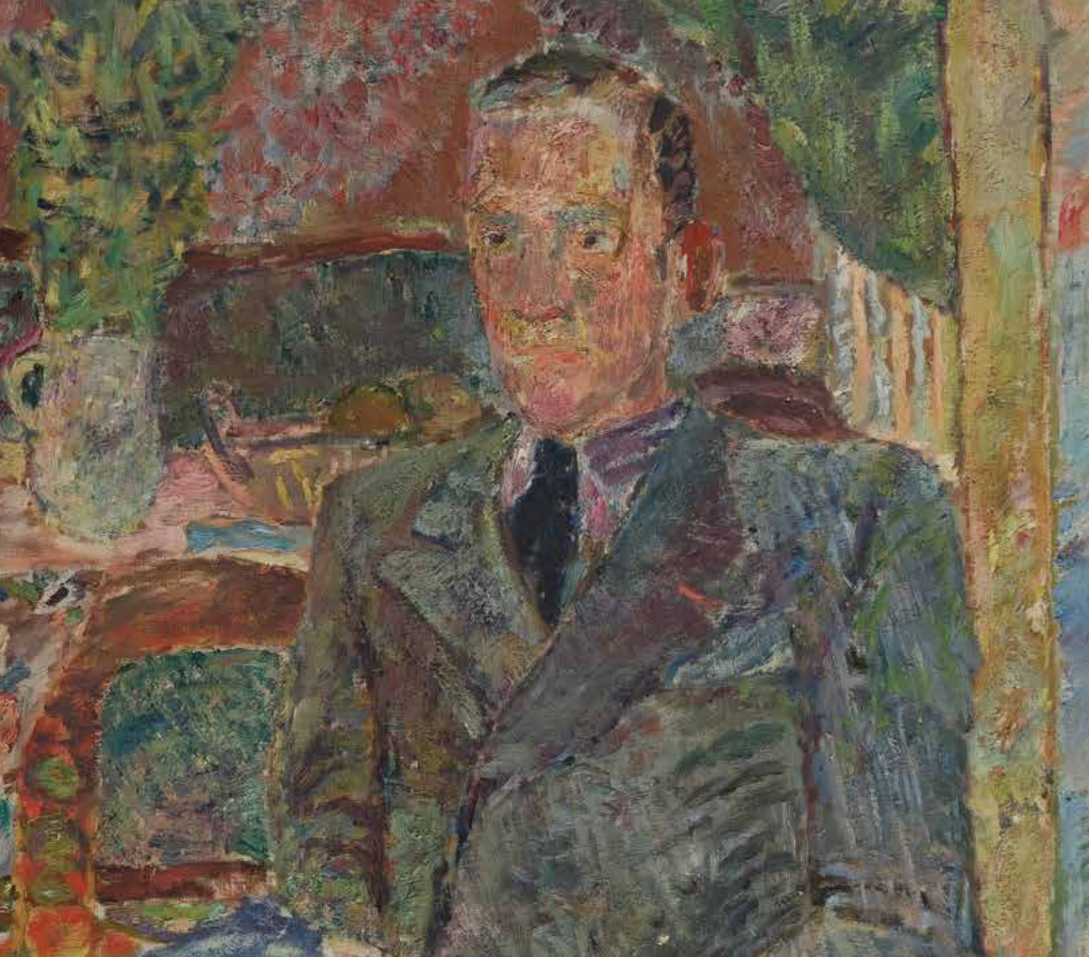
Jan Cybis, Portret mężczyzny, lata 30. XX w.